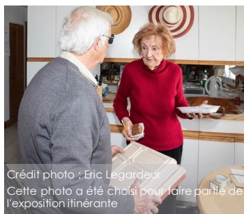
Cette photo a été choisie pour faire partie de l'exposition itinérante

Un bénévole et des clients de la popote roulante se sont portés au jeu des caméras et ont participé à un projet d'exposition itinérante organisée par Le Centre d'action bénévole du Contrefort de Québec (le CABQ). Ce projet vise à informer et sensibiliser la population sur la problématique de l'isolement social des personnes âgées.